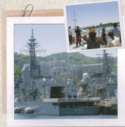
間近で見られる艦船は迫力満点! 案内人のお話を聞きながら、乗客の皆さん写真撮影に夢中で

ら、シャッターチャンスが次々に訪れます。途中、2階デッキに移動してみると、たちまち全身が潮風に包まれて気持ちいい! お子さまからご年配の方まで、歓声をあげたり興味津々といった表情を浮かべたり。アナウンスにも惹きこまれ、あつという間の45分でした。