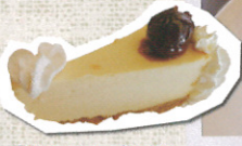
濃厚なチェリーチーズケーキの半分480円