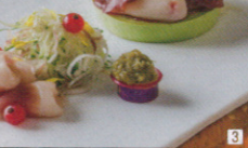
1 レトロな雰囲気がお座敷。窓の外には緑の庭があります 2 神楽坂の石畳のなかで最も歴史が古い兵庫横丁に面しています 3 大地鶏の卵を使った出し巻きと豚本直送の馬刺し三種盛りは人気の肴

03-3269-0779 住:東京都新宿区神楽坂4-8 交:東京外口東西線飯田橋駅B3出口から徒歩6分、神楽坂駅1番出口から徒歩9分 営:11時30分~15時(L.O.14時)、17時30分~23時(L.O.22時) 休:無休 MAP