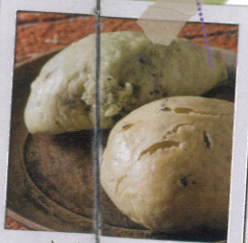
まんじゅう 小麦マンジュー 1個150円

【あかぎ寄席に関するお問い合わせ】 事務局(いたちや)☎03-5809-0550