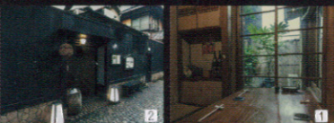
1レトロな雰囲気がお座敷。窓の外には緑の庭があります 2神楽坂の石畳のなかで最も歴史が古い兵庫横丁に面しています 3大地鶏の卵を使った出し巻きと熊本直送の馬刺し三種盛りは人気の肴

神楽坂を代表する兵庫横丁に面し、昔は芸者衆を住まわせた置屋だったという軒家を改装。黒塀に囲まれ、一見敷居が高そうですが幅広い年代の方がリラックスして過ごせると評判。料理長自ら吟味した素材は、北海道の大黒さんまや旬の松茸のほか、湯葉や生麩も絶品です。