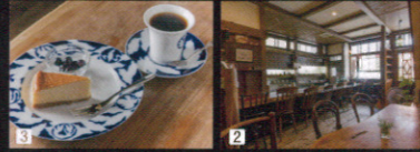
1 マスターが換くブレンドは「香りと酸味」「こくや苦味」の2種からセレクト 2 木の温もりがどこか懐かしく、つい長居したくなります 3 チーズケーキなどのスイーツはマスターの奥さまの手作り

03-3267-4538 住:東京都新宿区神楽坂6-16 交:東京外口東西線神楽坂駅1番出口から徒歩2分 営:10時~18時 休:木曜日・第1水曜日 MAP