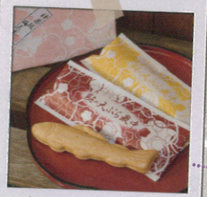
鮎の天ぷら最中 1個230円

☎03-5228-0727 住:東京都新宿区神楽坂6-15 交:東京メトロ東西線神楽坂駅1番出口から徒歩2分 営:10時~20時 休:不定休