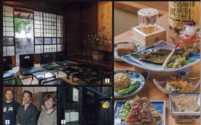
11月に2回変わる季節のコース料理。選りすぐりの旬の野菜や新鮮な魚介類が彩り鮮やかに 2 縁側のあるお座敷が和やかなひとときを演出 3 濃厚な黒塀に囲まれています 4 スタッフが笑顔でお出迎え

神楽坂上の通りを外れ、静けさに包まれた一角。その角にあるから店名は「カド」。昭和20年代に建てられた木造一軒家で、風流な黒塀が目印です。昔ながらの縁側がある座敷の奥には、椅子を配した洒落た和室も。昼はお子さま連れもよいですが、夜は日本酒片手に大人が差しつ差されつ語り合う場に。お膳に供される、その季節ならではのこちそうは見た目も鮮やかで会話に華を添えてくれそう。入口右手の立ち呑みスペースでは、地元の方々と酒を酌み交わすのもたまりません。神楽坂にふさわしい、大人が集う店です。