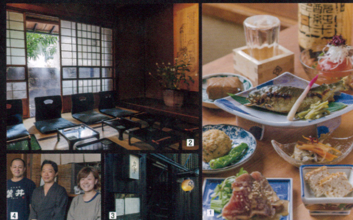
1月に2回変わる季節のコース料理。選りすぐりの旬の野菜や新鮮な魚介類が彩り鮮やかに 2縁側のあるお座敷が和やかなひとときを演出 3濃厚な黒塀に囲まれています 4スタッフが笑顔でお出迎え

神楽坂上の通りを外れ、静けさに包まれた一角。その角にあるから店名は「カド」。昭和20年代に建てられた木造一軒家で、風流な黒塀が目印です。昔ながらの縁側がある座敷の奥には、椅子をお子さま連れもよいですが、夜は日本酒片手に大人が差しつ差されつ語り合う場に。お膳に供されるその季節ならではのこちそうは見ても鮮やかで会話に華を添えてくれそう。入口右手の立ち呑みスペースでは、地元の方々と酒を酌み交わすのもたまりません。神楽坂にふさわしい、大人が集う店です。