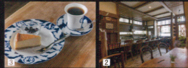
1マスターが挽くブレンドは「香りと酸味」「こくと苦味」の2種からセレクト 2木の温もりがどこか懐かし、ついで長居したくなります 3チーズケーキなどのスイーツはマスターの奥さまの手作り

03-3267-4538 住:東京都新宿区神楽坂6-16 交:東京メトロ東西線神楽坂駅1番出口から徒歩2分 営:10時~18時 休:木曜日・第1水曜日 MAP