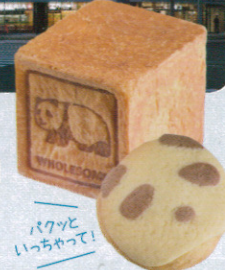
▲「UENOあんみつ」180円(上) パンダパン150円(下)

〒03-5812-7051(株)上広 住：東京都台東区上野公園1-57 交：京成上野駅から徒歩1分 営：各ショップにより異なります。各店へ直接お問い合わせください。 休：無休