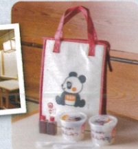
▲おみやげのあんみつ370円。パンダの保冷バッグ(300円)もゼ！

〒03-3831-0384 住：東京都台東区上野4-9-7 交：京成上野駅から徒歩1分 営：10時30分～21時30分(L.O.21時) 休：不定休