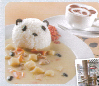
▲カレーdeパンダ 800円 カフェラテdeパンダ 400円