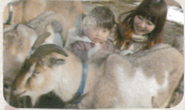
▲午前と午後がゴリラの観タイム。食べる様子を間近に見られます(上) ▲子ども動物園では家畜が放し飼いに。毎日楽しいイベントを開催(下)