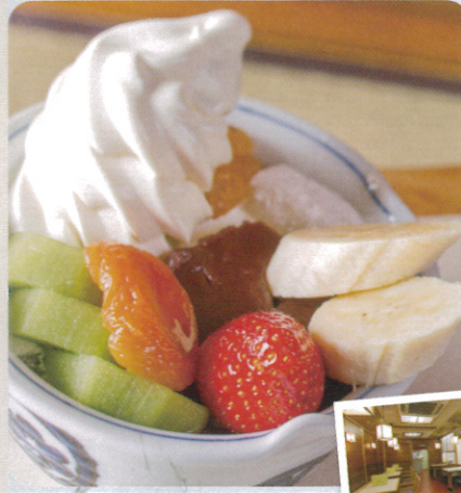
▲フルーツクリームあんみつ 710円 (フルーツは季節により異なります)

あんみつ類ご注文のお客様に「白玉または杏」トッピングサービス ※ご注文時に、本冊子をご提示ください。 ※1冊につき2名様まで ※有効期限2013年6月末まで