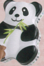
▲上野動物園オリジナルパンダ缶ビスケット 650円 ▲上野動物園オリジナルコヘアがま口 892円