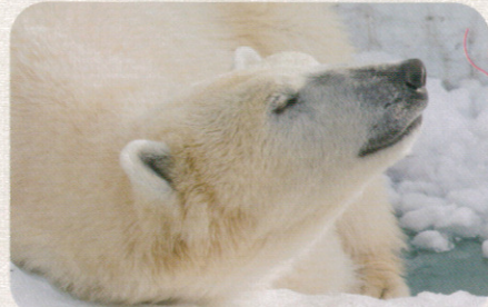
やわらかな日差しが さちさち♡