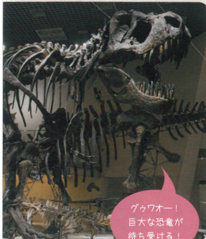
グワウオー！ 巨大な恐竜が 待ち受ける！

少し趣向を変えて、ミュージアムをめぐるのもステキ。上野には、由緒ある博物館や美術館が隣り合い、家族連れでもカップルでも、おひとりさまでもゆっくり鑑賞できます。ほんのつかの間、別世界に入り込んだかのような感覚に包まれて。