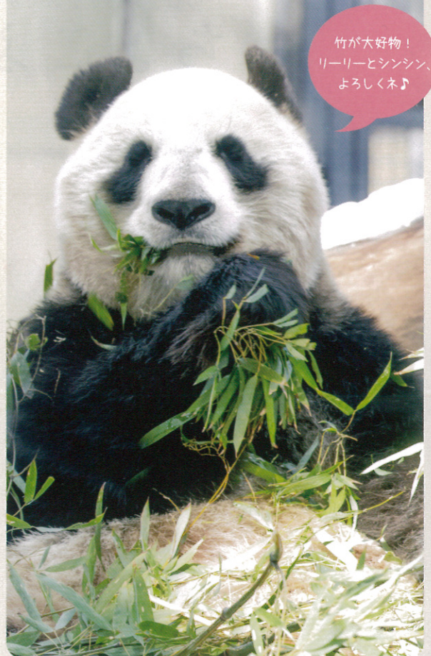
竹が大好き！ リーリーとシンシン、 よろしくね♪